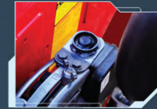
(575, 585 में उपलब्ध)

- आसानी से इम्प्लीमेंट को ऊपर या निचे लाये